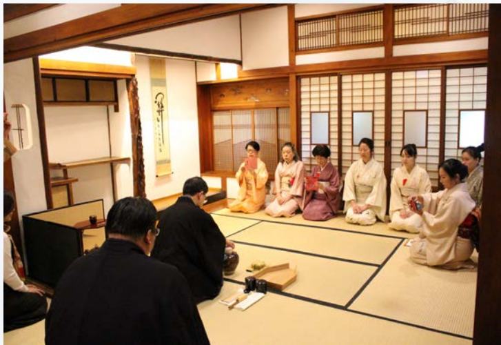
裏千家茶道正式課