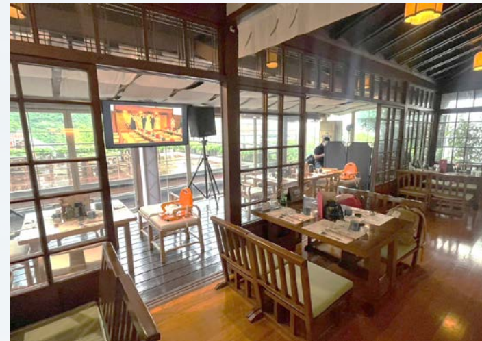
1-2樓包館婚宴同步轉播