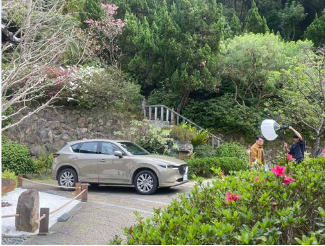
汽車雜誌平面拍攝