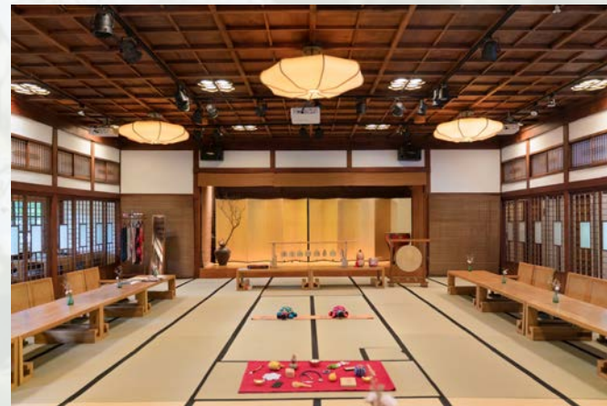
北投文物館佳山抓周宴會