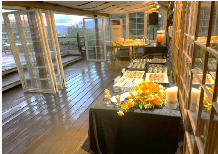
雞尾酒會自助餐桌